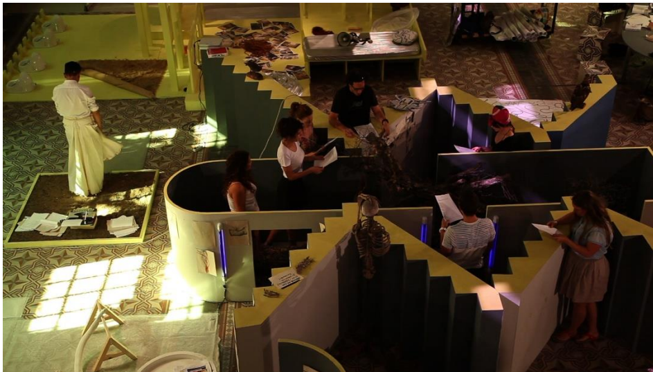
Ortak Eylem Aygıtı

İşlerimin doğrudan doğruya bir şey önermek gibi bir niyeti yok; dolayısıyla sınırlı cümlelerle konuşmaktan kaçınmak istiyorum. Ama bunu konuşma dilinde ifade etmek de öyle kolay bir şey değil. Toplantıda da söylediğim gibi, bu bir yapıt ve ben bunu bir mesaj taşıması veya bir teoriyi örneklemek için yapmıyorum. Dolayısıyla, kendi kendine ayakta kalması ve işlemesi ve anlam üretmesi beklenir. Bu yüzden 'aygıt' diyorum. Bu aygıtın içine pek çok şey koyuyorum ve onu kendi içinde işleyerek bu malzemelerden anlam üretmesini bekliyorum. Kavram ve nosyonların, ışık ve karanlık, korku ve güven, ses ve boşluğun, birbirlerini nasıl etkiledikleri dönüştürdüklerini izlemek istiyorum. Fakat aynı zamanda bunlar da çok 'benden çıkan' şeyler. Yani çok kişisel olan ile toplumsal olanın karşılaşması ve bir etkileşim alanı kurması olarak tarif edebilirim. Ve hayvan her zaman var, görüyorsun, 2000'de yaptığım Hiçbir yer / Gövde / Burası fotoğraf serisinde de yine post/kuzu kullanmışım... Belli bir 'vocabulary'm/söz dizinim var. Devamlı kullanıyor ve ondan vazgeçmiyorum.