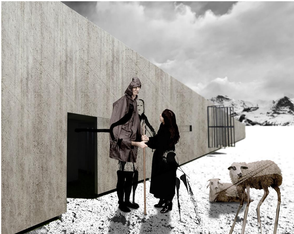
Biz, Başka Yerde / Eskizler İKSV'nin ve sanatçının izniyle

Biz, Başka Yerde , figürlerin kendi gölgeleri içe dönerek üstlerine düşüyor ve onları mekânsız bırakıyor. Bu her yerde dolaşan hayalî karakterlerin eksik olduğunu görüyoruz. Belki de tamamlanmamış bir hikâyenin diğer yarısı, hepsi birlikte olası bir 'tragedya'nın aktörleri gibi... Sanki, gerçekleşmek üzereyken iptal olan bir 'tragedya' var. Bu figürlere yakından baktığımızda, günlük hayat ve duygular, insan ilişkileri, aşk ve nefretten izler görebilirsiniz.